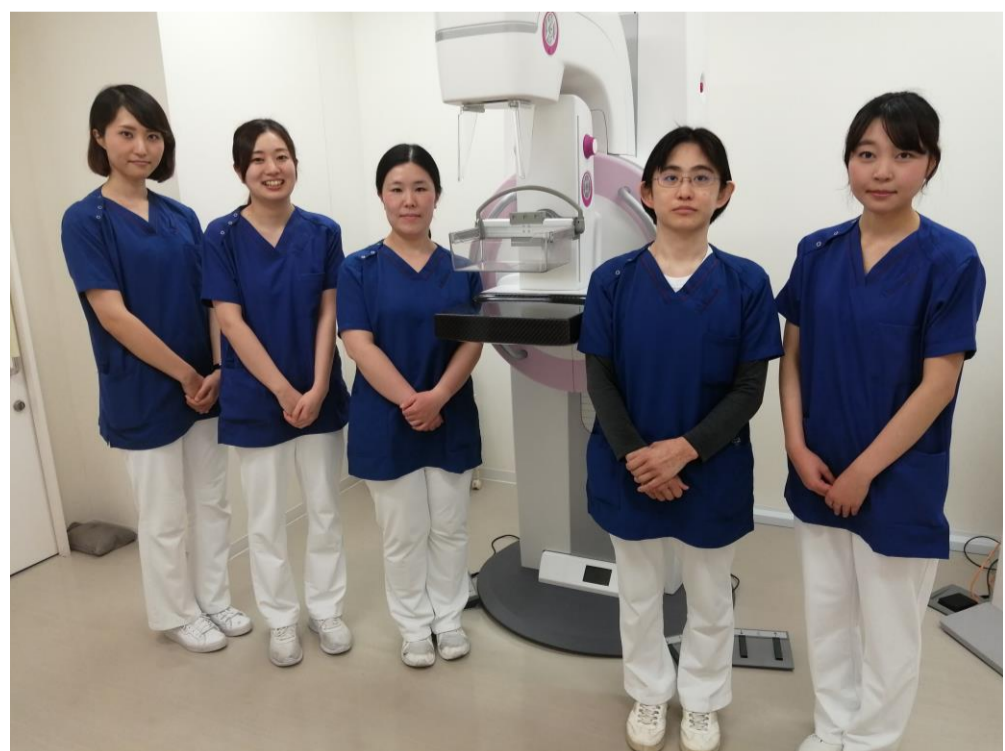
マンモグラフィ室